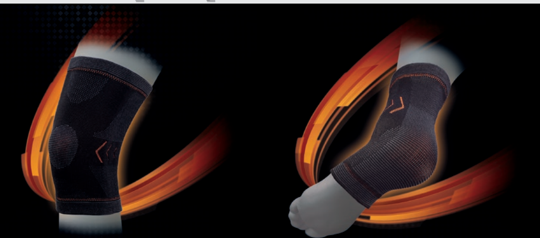
RODILLERA · KNEE · GENOUILLÈRE