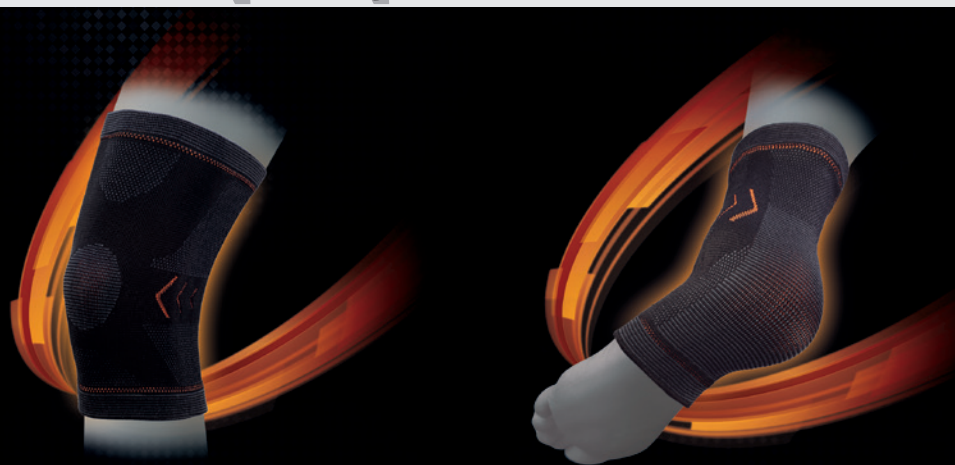
RODILLERA · KNEE · GENOUILLÈRE