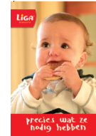
Well informed package