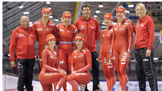
Internet ( www.LIGA.nl )