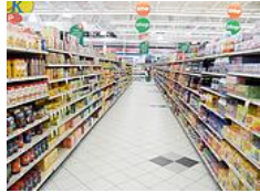
Good visible package

As a market leader in this segment LIGA takes the responsibility to stimulate the baby biscuit category